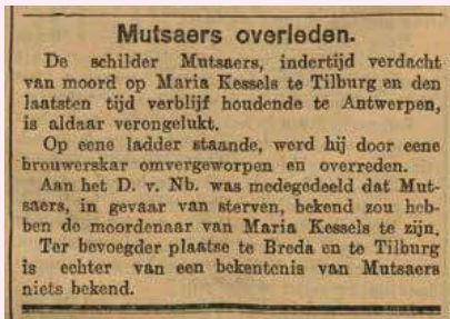
'Op eene ladder staande, werde hij door eene brouwerskar omvergeworpen en overreden.' Uit: Nieuwsblad van Friesland (15 augustus 1903)

terugnemen. De Telegraaf meldde die dag dat was gebleken dat het bericht 'totaal onwaar' was: 'Gisteren, zoo meldt de "Bred. Ct.", was de schilder M. te Breda, waar hij de redactie inlichtte dat men omtrent hem kon informeerden bij de politie te Antwerpen. Hij beklagde er zich over, dat telkens van zekere zijde onware berichten worden in de wereld gezonden over zijn persoon.' Drie dagen later publiceerde genoemde Bredasche Courant een artikel waarin werd gemeld dat de schilder juridische stappen had ondernomen tegen de Eindhovense krant. Hij was van mening dat men hem maar niet met rust scheen te willen laten: ieder jaar werden er in augustus, de maand waarin de moord was gepleegd, weer andere berichten gelanceerd die volgens hem 'absoluut onwaar' waren. 'Of men hierdoor de publieke opinie tegen dien man tracht gaande te houden, is met zekerheid niet te zeggen,' schreef de krant, 'doch het heeft er dan allen schijn van.' Een paar jaar tevoren had Mutsaers een bericht gelezen dat hij in Antwerpen van een ladder te pletter op straat was gevallen; weer een paar jaar later zou hij door een zware bierwagen in Antwerpen zijn doodgereden. Ook dit is feitelijk fake news , want zoals we gezien hebben, luidde de oorspronkelijke bewering dat de val van de ladder en de aanrijding door de bierkar min of meer tegelijkertijd hadden plaatsgevonden.