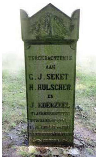
'Gelijktijdig door het hemelvuur gedood.' Begraafplaats Veenhuizen.