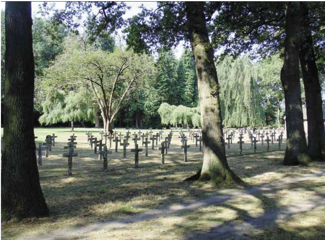
Begraafplaats Veenhuizen.